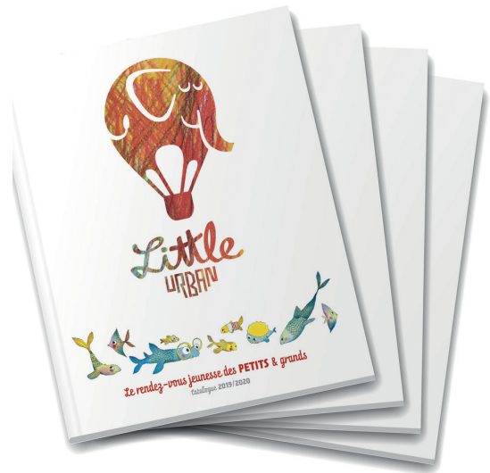
CATALOGUE 2019/2020 MDS : LU9049