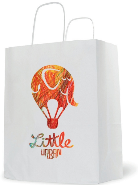
PACK DE 10 SACS en papier grand format MDS : LU9002